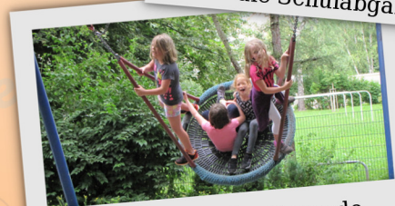
Hier findet jeder Freunde.