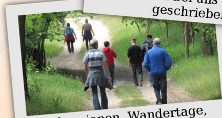
Exkursionen, Wandertage, Jugendherbergsfahrten