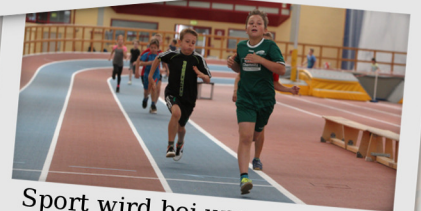
Sport wird bei uns ganz groß geschrieben!