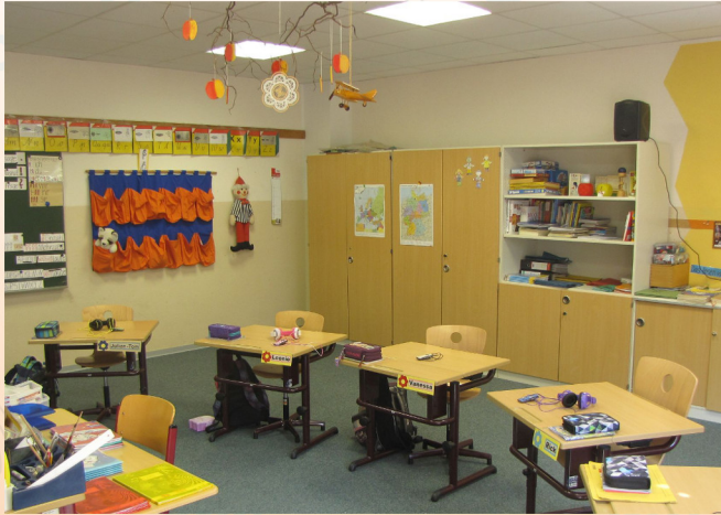
Ideale Lernbedingungen für Hörgeschädigte

Unser Schulalltag wird durch weitere Lernangebote ergänzt: