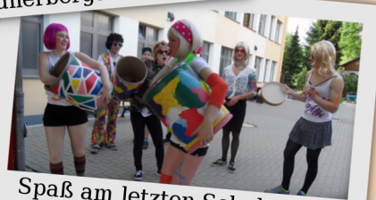
Spaß am letzten Schultag für die Schulabgänger.